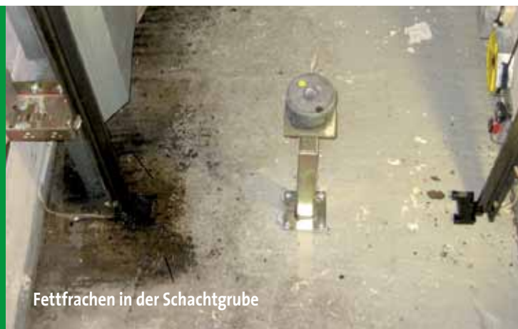
Fettfrachten in der Schachtgrube

Unsere Fachkräfte sind in enger Abstimmung mit der Berufsgenossenschaft umfassend geschult. Sie verstehen die komplexe Technik, kennen Ursache und Wirkung von Verschmutzungen und haben für jede Reinigungsaufgabe spezielles Reinigungsequipment parat.