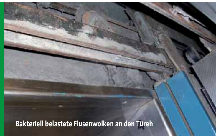
Bakteriell belastete Flusenwolken an den Türen