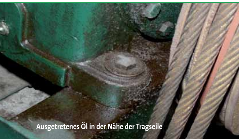
Ausgetretenes Öl in der Nähe der Tragseile

Trockene oder feuchte Staubsammlungen, insbesondere im Bereich von Türen und Schachtgruben, sind häufig bakteriell oder fungizid belastet. Daher ist es unerlässlich, dass die Reinigungsflotte gleichermaßen fettlösend wie desinfizierend wirkt.