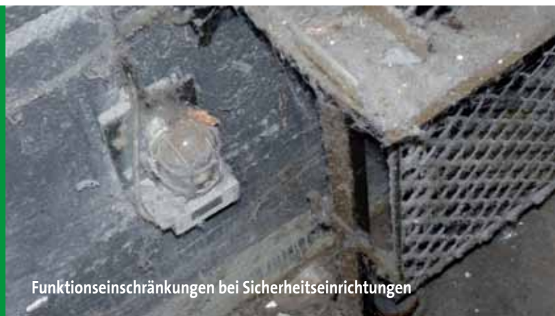
Funktionseinschränkungen bei Sicherheitseinrichtungen