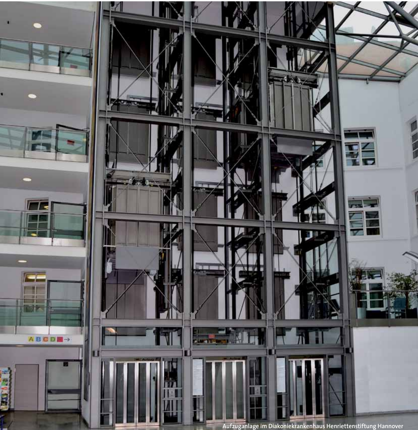
Aufzugsanlage im Diakoniekrankenhaus Henriettenstiftung Hannover